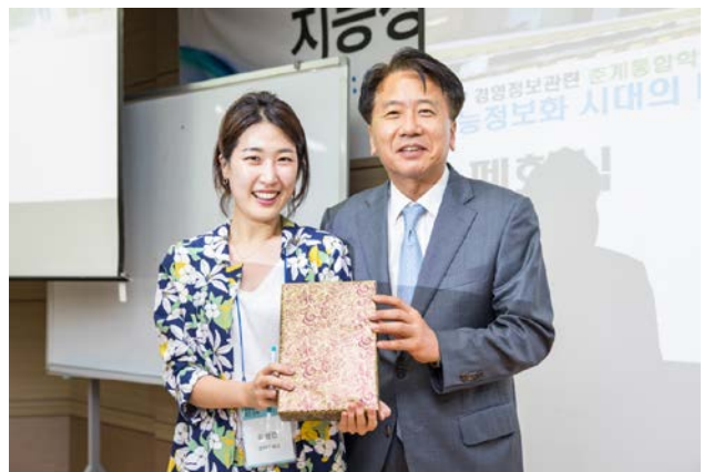
▲ 경품 1등 수상자와의 기념사진