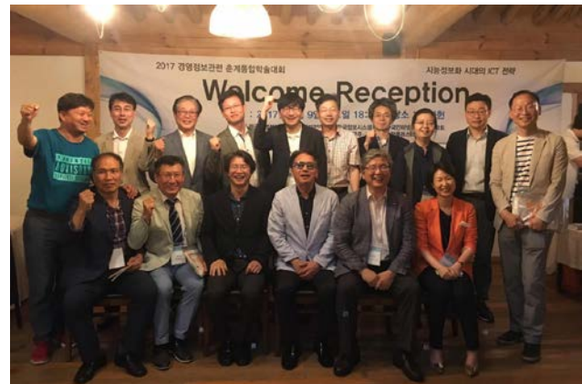
▲ 환영만찬 참석자들의 단체 기념사진