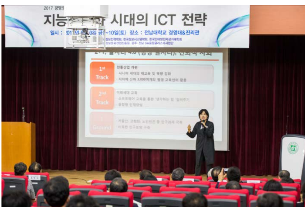
▲ 기조강연을 발표하고 있는 송희경 국회의원