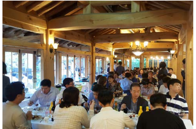
▲ 행사장인 오가현을 가득 메운 참석자들