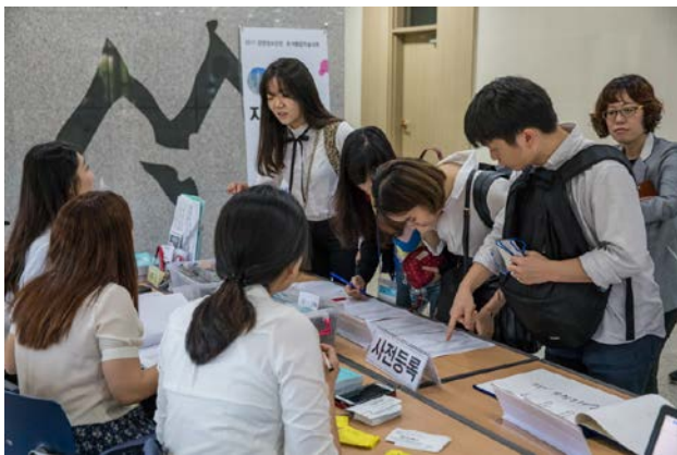
▲ 사전등록 확인 및 이름표 교부 이루어지고 있는 등록데스크