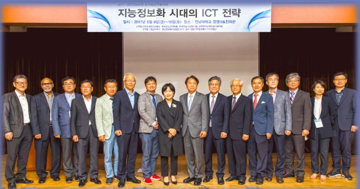
▲ 개최식에 참석한 내빈들의 기념 사진

이번 뉴스레터에서는 이처럼 다채로웠던 춘계 통합학술대회의 이모저모를 현장 사진과 함께 여러분께 소개합니다.