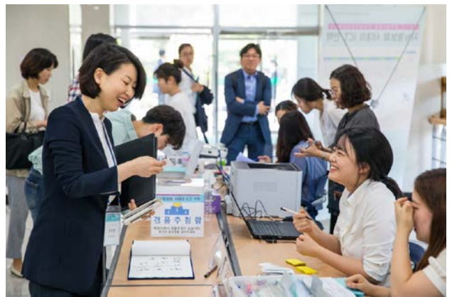
▲ 모든 학회참가자들에게 경품추첨의 기회가 제공되었음