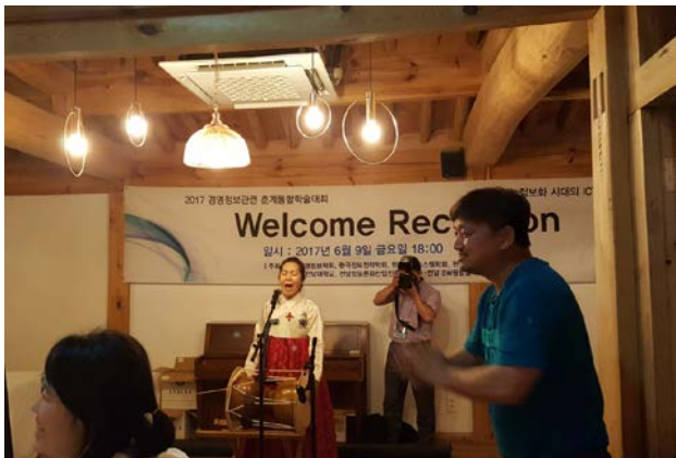
▲ 관객과 함께 호흡하는 공연의 클라이막스