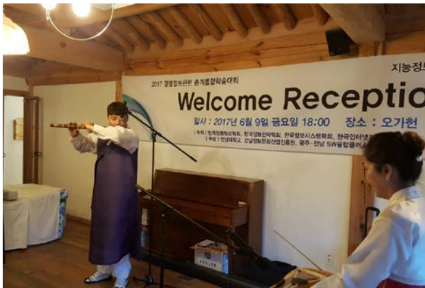
▲ 명인의 단소 공연