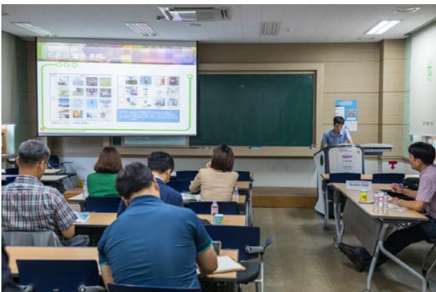
▲ ICT와 농축업 세션에서 연구결과를 발표 중인 가톨릭관동대 연구팀