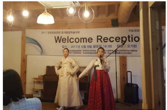
▲ 창과 한국무용의 앙상블